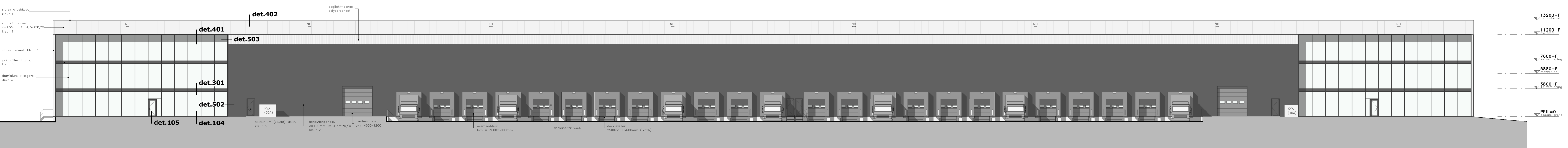
ACHTERGEVEL / NOORD- OOSTGEVEL